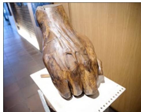
Skrivkramp är en av träskulpturerna som Sven-Ingvar ställer ut.