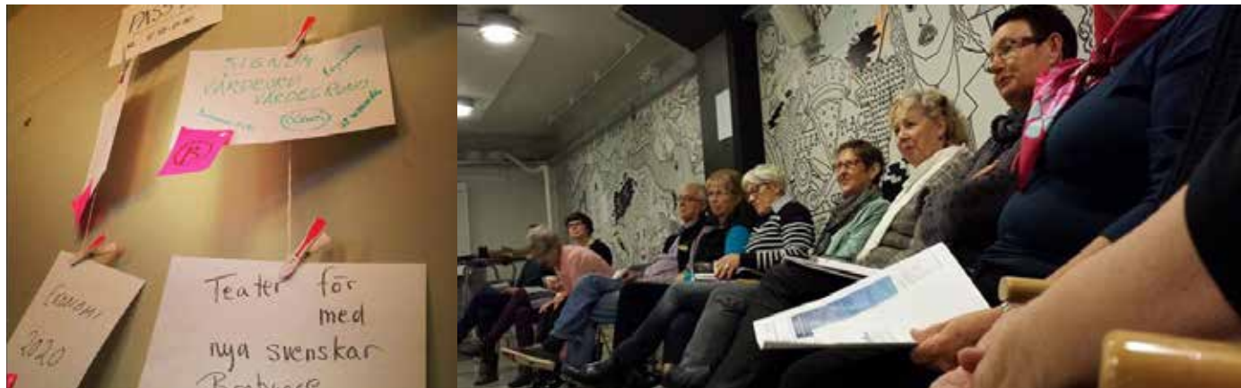
Framtidsforum i Göteborg