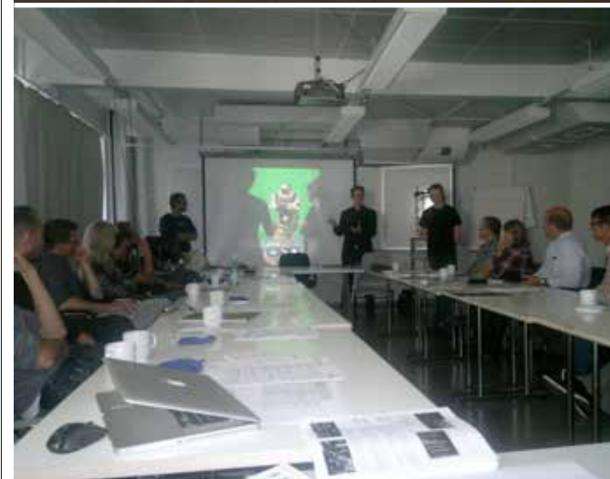
Hamlet's Norwegian Dollhouse, Workshop.