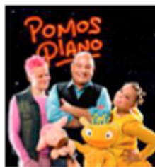
Pomos Plano.