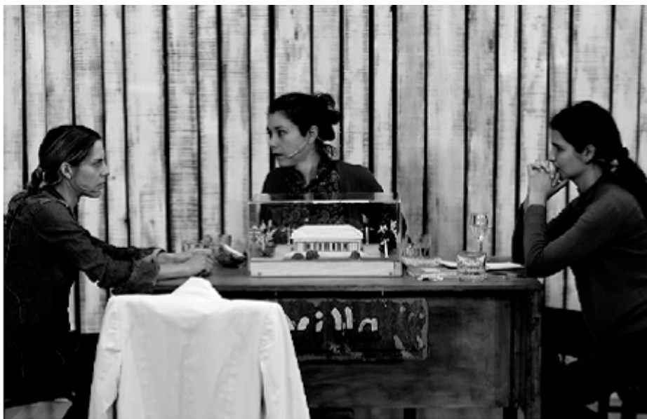
Villa • Talet.