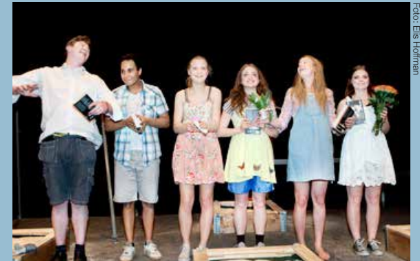
Länk-festivalen i Hallunda våren 2012.

Vill du få kontakt med unga teaterintresserade på din ort? Samarbeta med Länk! Det finns flera sätt att som teaterförening samarbeta med Länk. Kontakta oss för att hitta en samarbetsform som passar just din förening. Kontaktuppgifter finns på http://skolscenen-lank.riksteatern.se/kontakt .