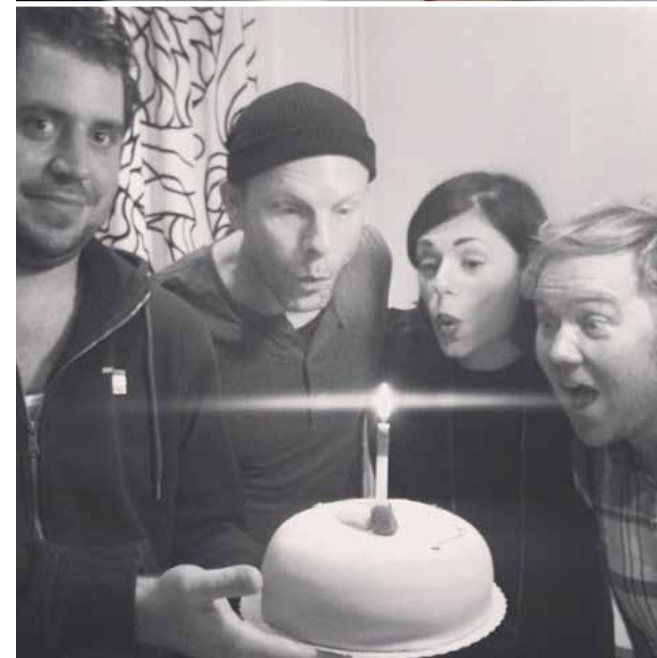
Tårta på ingång.