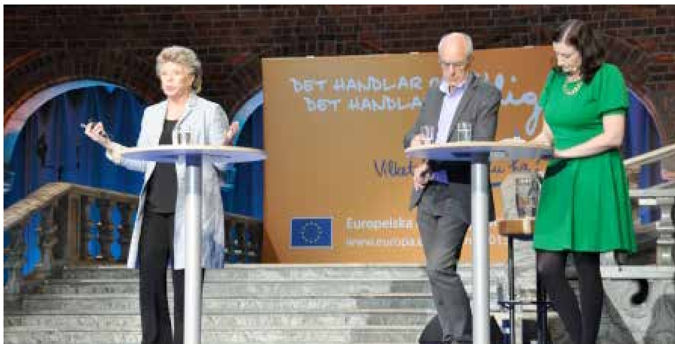
Från Blå hallen i Stockholm stadshus.

För egen del blev medborgardialogen starten på nya kontakter i Jönköping. Tack EU kommissionen för