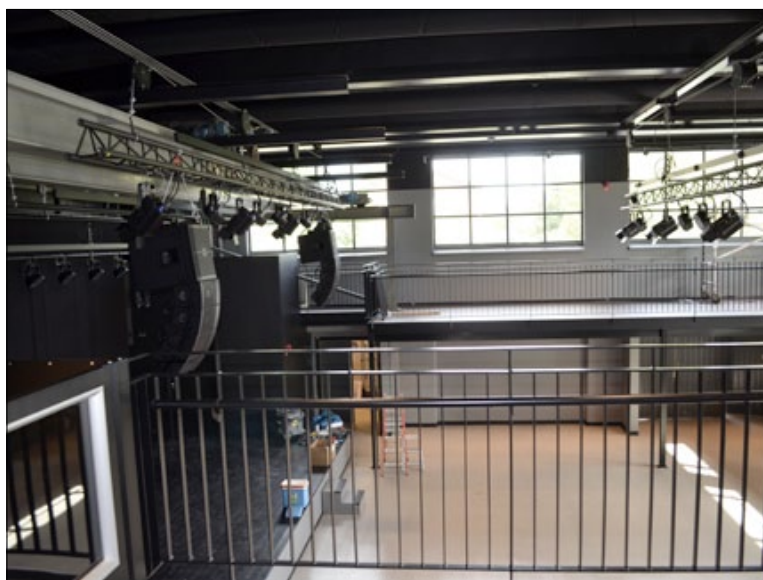
Här ska Musikhusets konserter hållas.