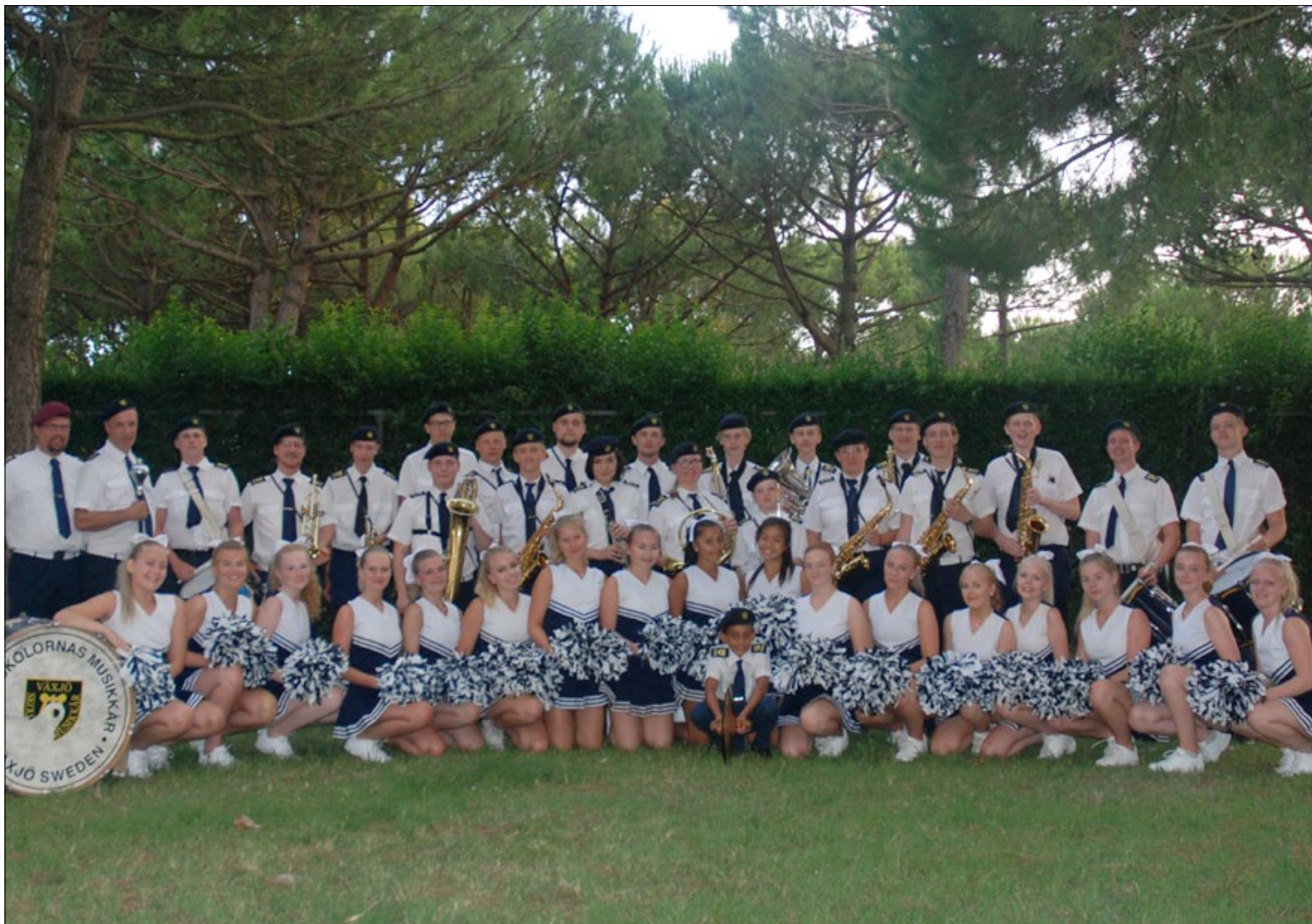
Växjöskolornas musikkår är med på invigningen.