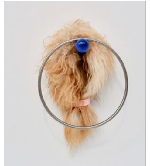
"Tillbaka till skogen" drar tankarna till ett piercat kvinnligt underliv.